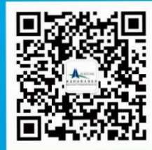
「XEDA 科学技術」 Wechat 公式アカウント