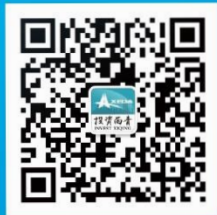
「投資西青」 Wechat 公式アカウント